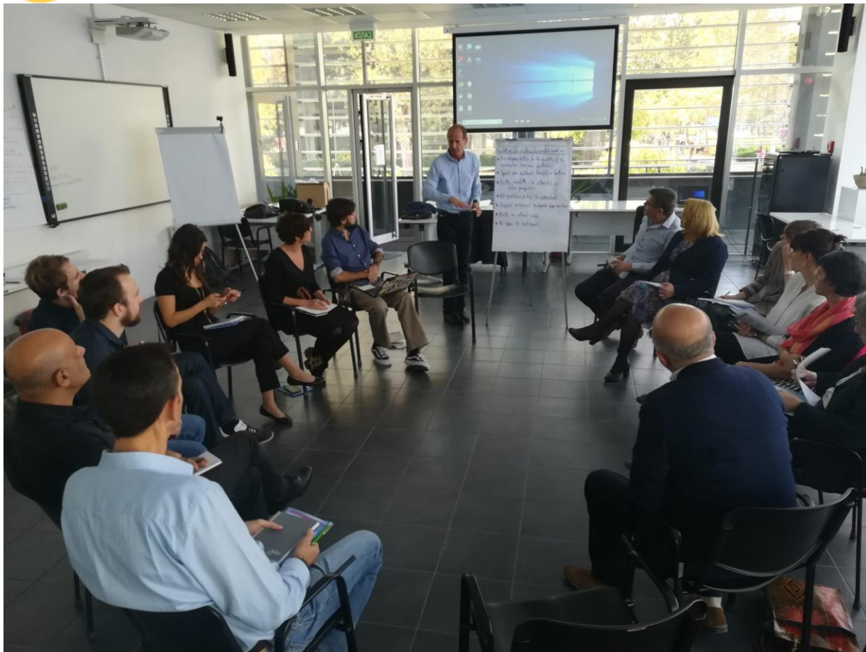
Slika 2: NewHoRRizon društvena laboratorija organizovana u Novom Sadu oktobra 2019. godine.